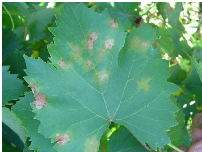
Inicio de enfermedad con mancha aceitosa.

Esto resulta interesante desde el punto de vista de poder utilizar un producto alternativo como el cobre líquido amoniacal para los años de mucha incidencia de la enfermedad.