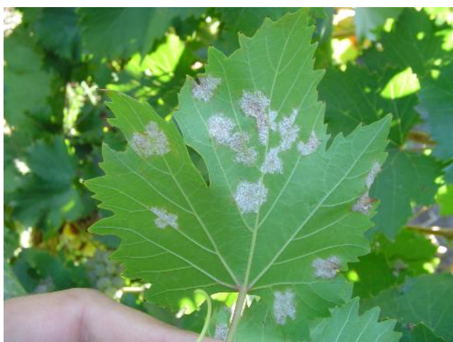
Cara adaxial de la hoja, con esflorescencia blanquecina.